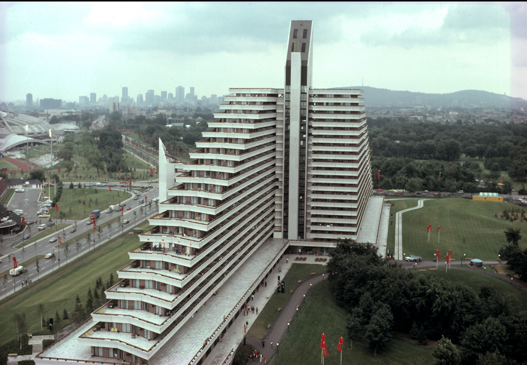
Le Village Olympique, 1976, architectes D'Astous-Durand

Un éminent architecte québécois revient à New Delhi où il débuta sa carrière il y a cinquante ans. Il part à la recherche de ses projets. De Montréal à Genève, de New Delhi à Chandigarh, la vie étonnante d'un électron libre de l'architecture moderne, Luc Durand, auteur du Pavillon du Québec à l'Expo 67 et du Village olympique pour les Jeux de 1976.